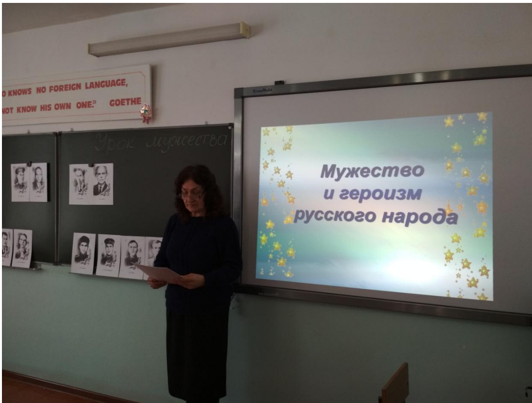
«Победные дни России..», кл.час 8-10 классы, Дзамыхова С.А.